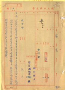
司令台及看台建築工程。