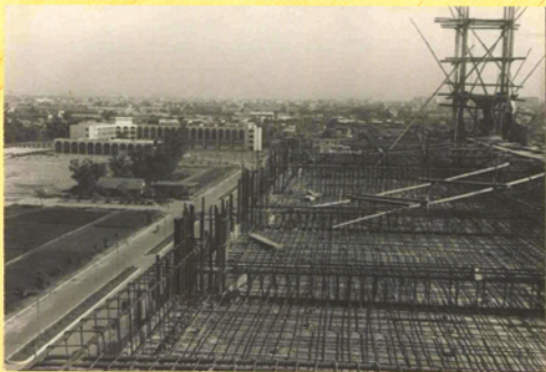
檔案所見，興建中的中正紀念圖書館，依稀可見後方之雲平樓。