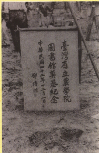
民國42年省立農學院圖書館奠基紀念與圖書館外觀照片，位於當時椰林大道運動場右側的一棟二層樓建築，設有閱覽座位320席。