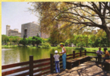
▲民國94年時的中興湖