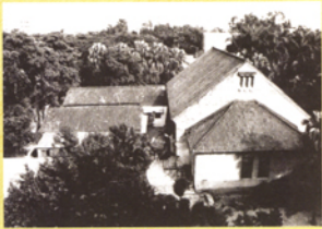
國立中興大學時期，未經改建前之小禮堂。