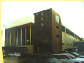
左上圖為早期游泳池的興築情況，右上圖為興建完成的游泳池外觀。

漫步校園，款款情懷，悠悠書香，隨意一處建築，皆烙下歷史變遷的點點痕跡。時光走廊，今昔相憶，其中尤以圖書館為最。