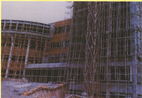
興建中的中正紀念圖書館。