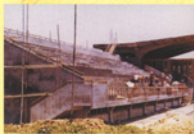
此為當時運動場看台的興建情況。

民國66年以後開始於新徵收而來的土地興建體育設施。相繼開闢運動場、看台，接著為游泳池、籃球場及排球場等，增加了學生的活動空間，也使得中興的體育設施趨向完善的地步。