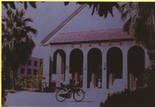
省立中興大學時期小禮堂，稍微整修後作為學生活動中心，左後方為理工大樓。