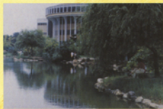
▲民國85年時的中興湖