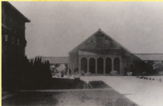
省立農學院時期之小禮堂，右側為圖書館，左前為行政大樓，左後為第三餐廳。

民國88年6月25日展開小禮堂重建工程，唯因小禮堂伴隨學校多年，為學校著名古蹟與地標，故重建時仍以原本姿態重新打造，並將堂邊平房改建為L型兩層樓房。雖然歷經921地震的考驗，仍於89年7月如期完工。同年9月15日舉行落成典禮，至此小禮堂成為學生社團活動的場所。