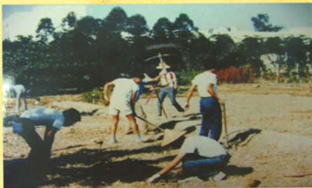
▲學生幫忙建造南園

而綜合大樓前的停車場，過去也曾經是南園的所在地，現今在原地只保留了其石碑。原本此地是爲了法商學院而保留下來，後來於民國67年由工讀學生整理成規模較大的花園，種植花草樹木，成爲校園另一個休閒的地點。南園同雙池一樣，都在學校的變遷中消失了其蹤影，只留下石碑見證其存在。