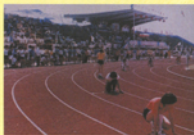
現今的田徑場已為PU跑道。